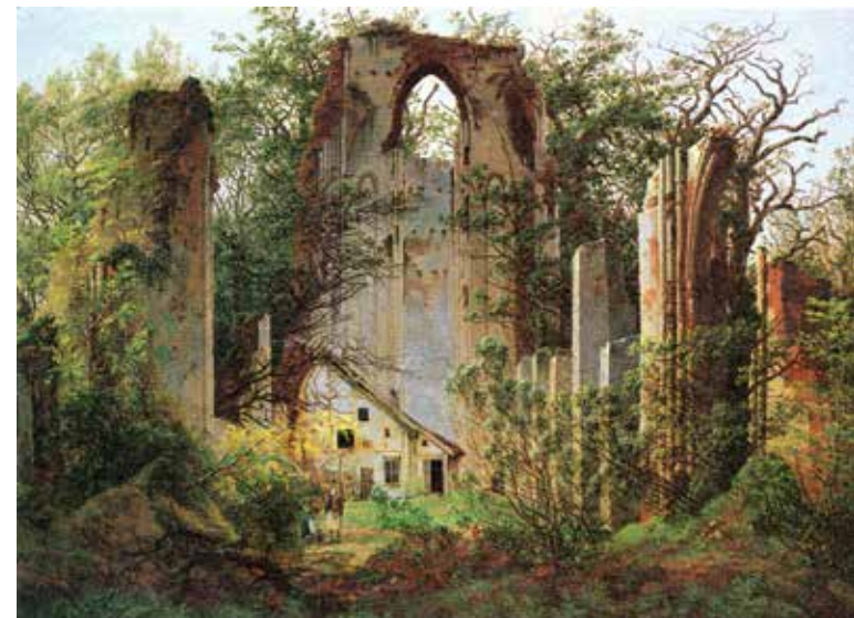
Quelle Titelbild: Caspar David Friedrich, „Ruine Eldena“, 1825 (wikipedia/gemeinfrei)