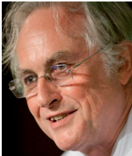
Nach eigener Aussage „ein ziemlich militanter Atheist“, der britische Zoologe und Autor Clinton Richard Dawkins (*1941). Einer der bekanntesten Vertreter des „Neuen Atheismus“.

Was sich biblisch gut begründen lässt, hat für manche Zeitgenossen jedoch längst an Plausibilität verloren. Begriff und Sache der theologischen Apologetik gelten als von gestern, weil sie nicht in das Zeitalter interreligiöser Verständigung passt. Sie könnte den Frieden in der pluralistisch-multireligiösen Gesellschaft ja vielleicht stören. Und für die Vertreter des neuen Atheismus gehört